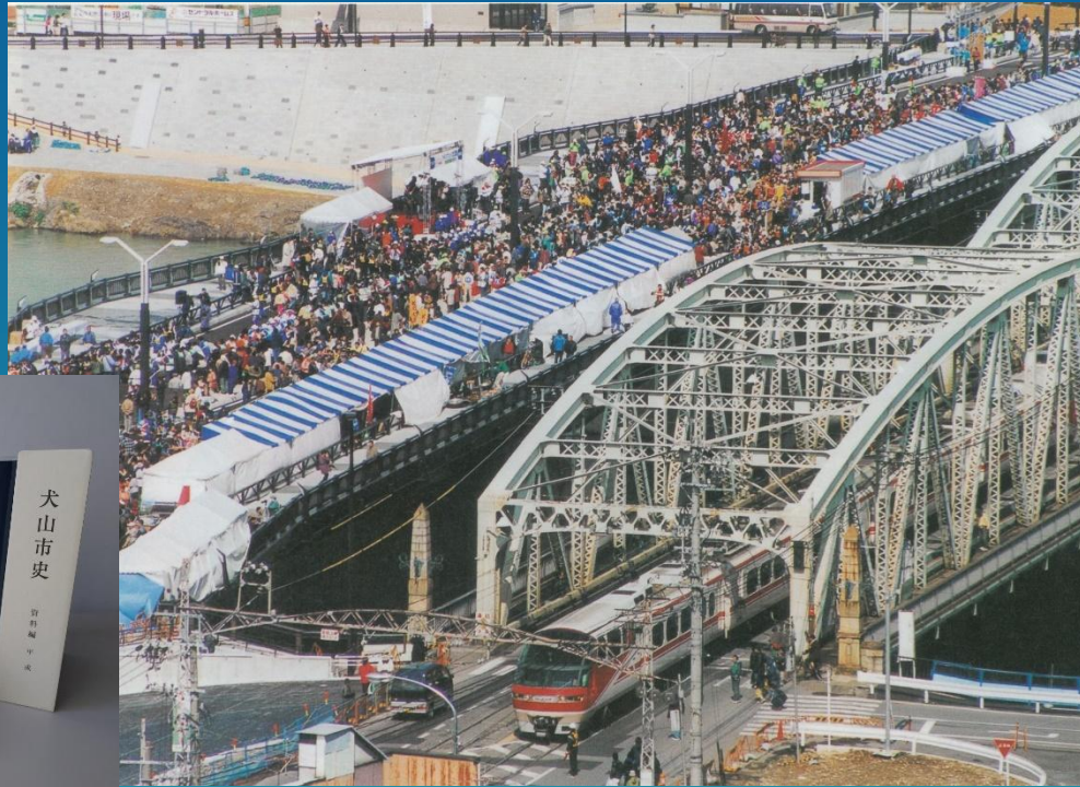
ツインブリッジ完成記念交流祭（『広報いぬやま』2000年4月15日号）