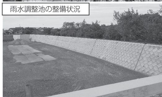
建設地の状況 (令和6年10月末時点)