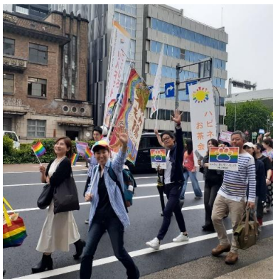
レインボープライド