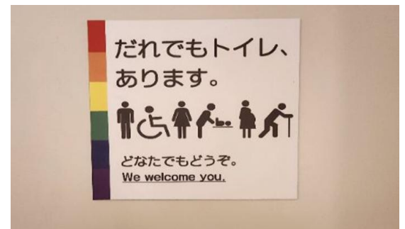
するすみ交流センター内多目的トイレ