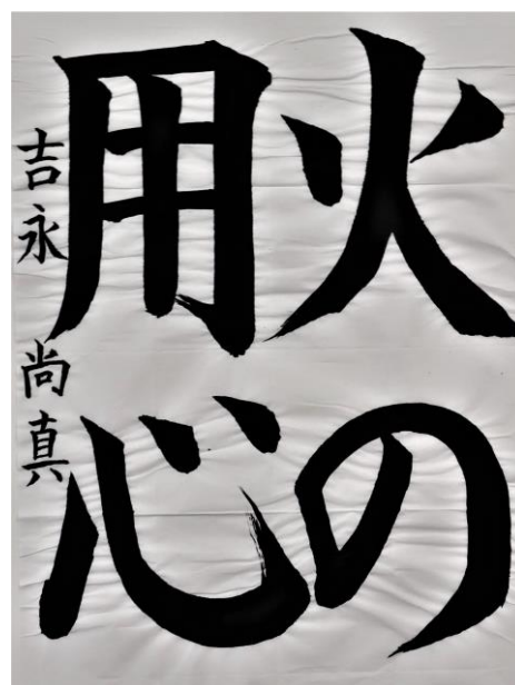
令和4年度 防火書道展 小学生の部 優秀作品