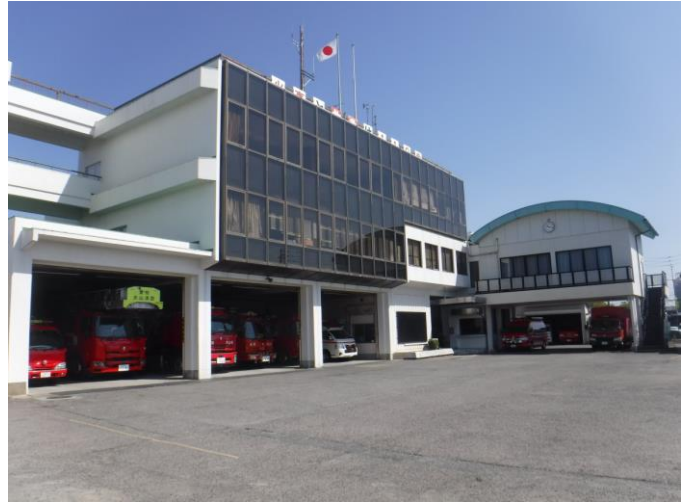
(犬山市消防本部・消防署庁舎)

消防用の施設・機械は、年々複雑多様化する各種災害にいち早く対応するため、常に最新の装備を兼ね備えた消防車両の導入や消防水利の設置などを積極的に進め、消防力の充実強化を図っています。