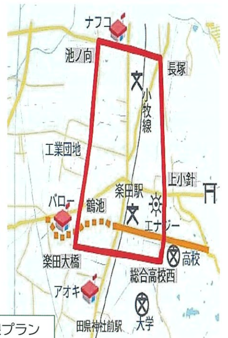
楽田環状線プラン

次の整備路線は【蝉屋長塚線】【楽田桃花台線】です。将来的には【楽田環状線】のようにぐるっと周回できるよう整備して楽田駅周辺の混雑緩和を目指します。