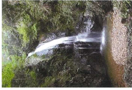
大山市 八曾の滝（山伏の滝）

（現状の各年齢階層における支援状況を答弁いただいた後） 質問：今後、支援の一元化や中学卒業後から18歳未満までの支援の拡充など抜本的改善について副市長：各支援部署での連携強化を強め、対応していきたい。