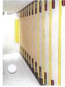
写真 上：階段の段差シール 下：エレベーター内の防災イース

① 公共施設のすべてのエレベーターに「防災イース」の設置 ② 公共施設や駅の階段に赤色と黄色の「段差シール」の施工を提案しました