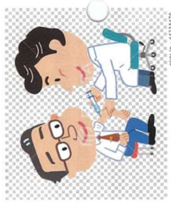
Illustration credit: 4013476

質問：犬山市でも带状疱疹ワクチンの助成を実施できないか。 健康福祉部長：ワクチン接種助成は、すでに実施計画に上げており、令和5年度からの実施に向け準備を進めている。