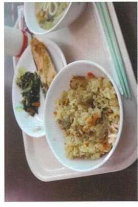
写真 「郷土の味に親しむ学校給食」犬山市より

質問：2022年9月から12月の学校給食無償化について、文部科学省が地方創生臨時交付金を活用し、保護者負担の軽減を促しているとのことですが、今回の犬山市の4カ月間の無償化についてどのようであるか。 中村教育部長：75食として試算すると、小学生で一人21,750円、中学生一人25,500円となり、子育て世帯の負担軽減につながる。保護者から「助かります」という声を一番多くいただいている。 質問：問題はその後だ。地方創生臨時交付金が出れば、これは実施してほしいし、そうでなくても何らかの形で保護者負担の軽減を図る。このように自治体としての努力が大事だ。 市長：新たな地方創生臨時交付金の通知は来ているが、いつ、幾らかは示されていない。使途の中に給食費の軽減も含まれていると聞いている。今後この給食費への対応も一つの選択肢として検討したい。