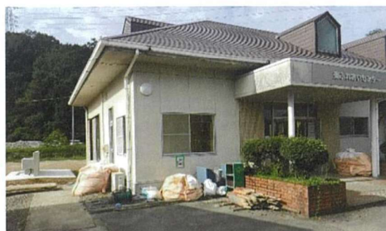
上 改築される 犬山南小学校北舎 左 東ふれあいセンター