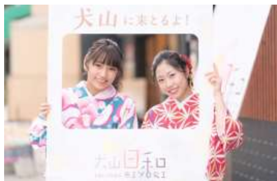
フォトパネルイメージ