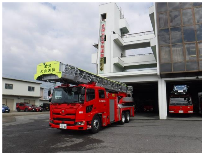
(梯子車 (40m級) 令和4年3月配備)

消防用の施設・機械は、年々複雑多様化する各種災害にいち早く対応するため、常に最新の装備を兼ね備えた消防車両の導入や消防水利の設置などを積極的に進め、消防力の充実強化を図っています。