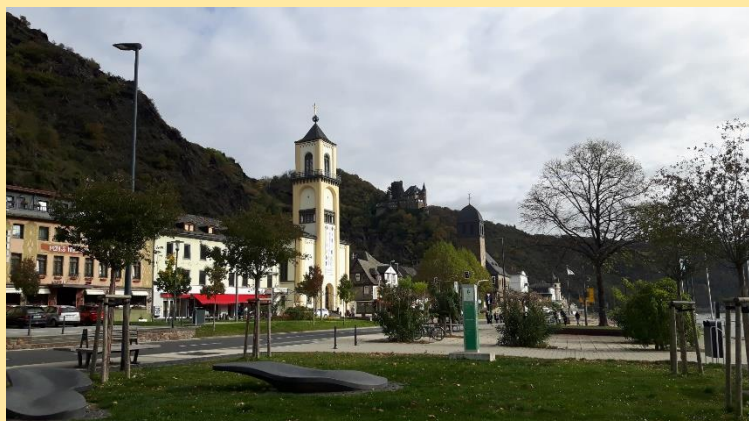
ザンクト・ゴアルスハウゼン市

ドイツの料理販売、ドイツのボードゲーム、ミニドイツ語講座など に参加ができ、衣装展示やドイツ飾り、ザンクト・ゴアルスハウゼン市の ローレライ校に通う中学生から送られたザンクト・ゴアルスハウゼン市を 紹介するポスターなどを見ることができます。