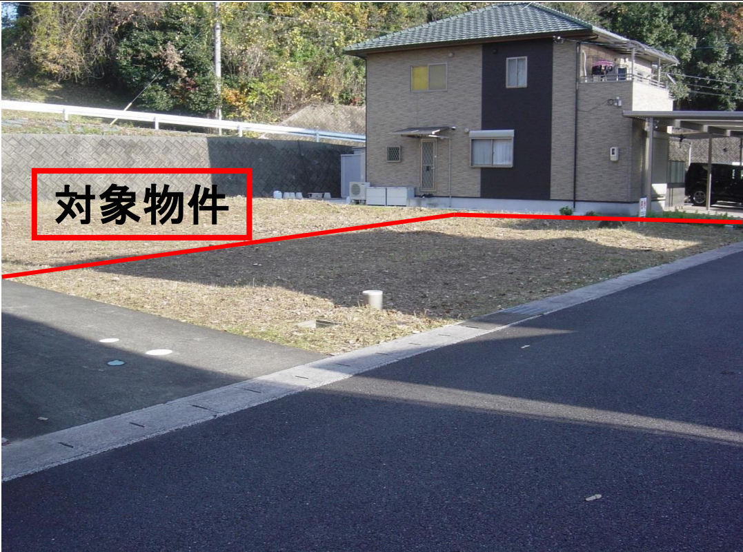
犬山市四季の丘四丁目 4 4