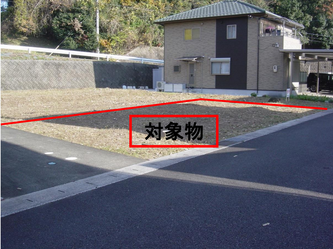
犬山市四季の丘四丁目 4 3