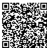
Código QR del sitio WEB

《El método de reserva》 Reserve a través de cualquiera de los métodos siguientes. ① Llamar al centro de llamadas para reservas y consultas de la ciudad de Inuyama. ② Reservar en el sitio WEB. https://www.city.inuyama.aichi.jp/1006634/1007443/1007807.html También puede acceder al sitio WEB mediante el código QR indicado abajo. Están escrito en Japonés, Inglés, Chino (Simplificado • Tradicional), Coreano, Portugués, Español, Vietnamita y Nepalí. ③ Reservar en la ventanilla. ※ Solo durante el período desde el 5 de julio (lunes) hasta el 18 de julio (domingo). ※ No hay intérprete. Lugar : Ayuntamiento, Tonoji Kominkan (centro público Tonoji), Nambu Kominkan (centro público Nambu, Gakuden Fureai Center) Hora : 9 : 00 ~ 17 : 00