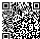
Instrucciones para la vacuna de Pfizer