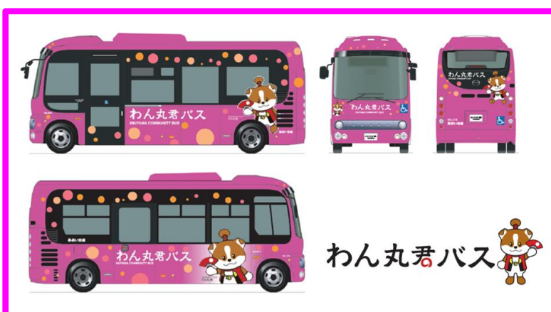
わん丸君バスラッピングイメージ