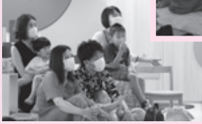
◀読み聞かせに 聞き入る参加者たち