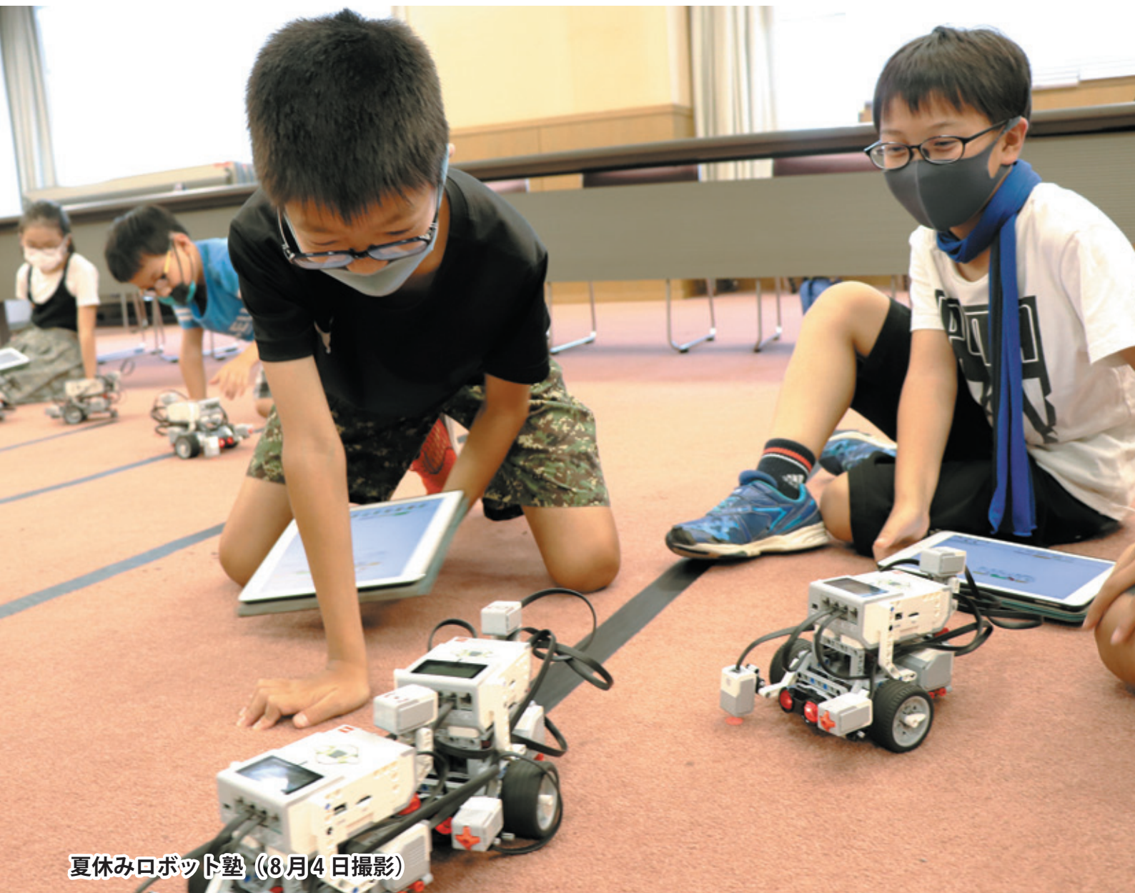
夏休みロボット塾 (8月4日撮影)