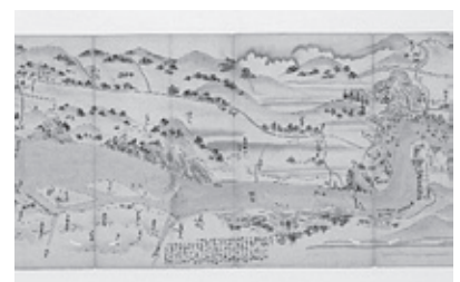
▲木曾川川並絵図(部分)