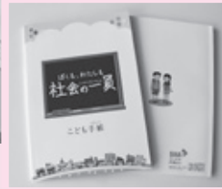
寄贈されたこども手帳▶