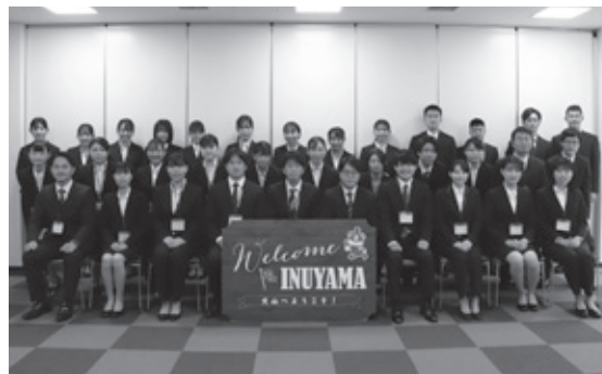
▲令和3年度採用職員

市民とともにまちづくりを積極的に進めるために、職員自ら「犬山市内に居住すること」を推奨します。この考えに共感し、意欲とやる気にあふれる人の応募を待っています。