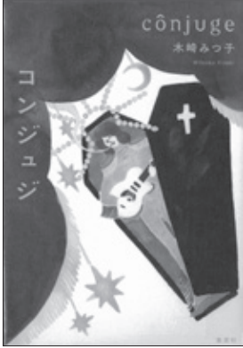
コンジュジ 木崎みつ子著

独り、過酷な現実を生きている小学生のせれなの人生に伝説のロックスター・リアンが舞い降りた。その美しい人は、せれなの生きる理由のすべてとなって…。一人の少女による自らの救済を描く。『すばる』掲載を単行本化。[すばる文学賞(第44回)]