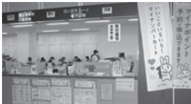
▲現在の市民課窓口

令和3年度中に、新たなシステムを導入することで、市役所市民課や各出張所における証明書等の発行手続きや、住所等の異動手続きの際に、申請書類の記入を不要とし、来庁した人が「書かなくていい窓口」にします。