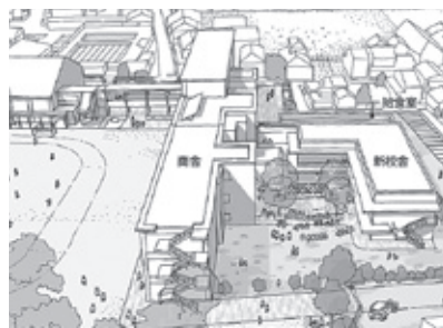
▲改修後のイメージ

より安心安全な教育環境の施設整備と、犬山南小学校区の拠点として利用しやすい複合施設を目指します。