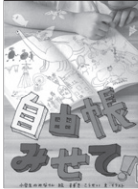
自由帳みせて! ずきこうせい 文・イラスト

独り、過酷な現実を生きている小学生のせれなの人生に伝説のロックスター・リアンが舞い降りた。その美しい人は、せれなの生きる理由のすべてとなって…。一人の少女による自らの救済を描く。『すばる』掲載を単行本化。[すばる文学賞(第44回)]