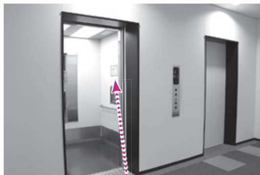
広告掲載する側面

※16:00以降の入館に限りです。※犬山市民に限り利用できます。※本券1枚につき、5人まで使用可 ※駐車場は別途料金が必要 ※他の割引券との併用、団体利用、コピー、転売は不可 ※シルバー・中学生・高校生は証明が必要 有効期間:令和3年5月1日(土)～4日(祝)