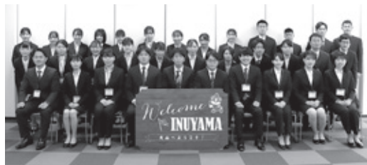
▲令和3年度採用職員

市では市民とともにまちづくりを積極的に進めるために、職員自ら「犬山市内に居住すること」を推奨しています。この考えに共感し、意欲とやる気にあふれる人の応募を待っています。