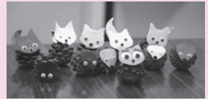
▲参加者の作った松ぼっくりのハリネズミとキツネ

自分で企画した事業だけではなく、市内の学校やボランティア団体から派遣依頼があれば、そこへ行くこともあります。東小学校6年生の総合学習の授業では、修学旅行の時の、外国人観光客に向けて児童が作ったパンフレットにドイツ人として感想を言ったり、ドイツの国や文化を紹介したり、一緒にドイツ料理を作ったりしました。犬山市で活動している団体では依頼されたテーマについて講演したり、ワインまつりなどの地域のイベントに行ったりしたこともあります。皆さんもドイツについて知りたいことや私が参加できるイベントがあればぜひ声をかけてください。