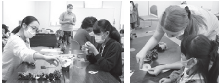
▼昨年の「秋祭り作り」