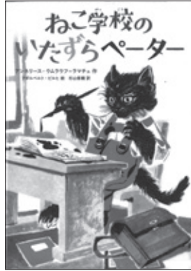
ねこ学校のいたずらペーター、アンネリース・ウムラウフ=ラマチュ作

線やマス目がないので、絵や文字を自由にかきこむことができる自由帳。友だちの自由帳には、なにがかいてある? 現役小学生から、かつての小学生までの100冊以上の自由帳を紹介した、読んだとたんにかきたくなる本。