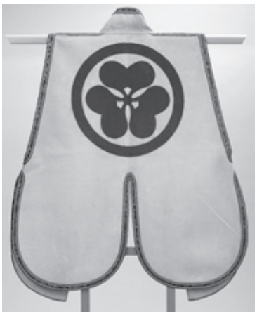
▲修復された白地陣羽織

犬山城白帝文庫は、歴史的資料の保存のため、様々な分野の文化財の修復を毎年行うとともに、必要な場合には資料の復元や複製の制作に取り組んでいます。これまでに絵画、染織品、武具、刀剣、甲冑 かっちゅう などを修復してきました。また復元した資料には、尾張藩主に対する犬山城主の「おもてなし料理」などがあります。