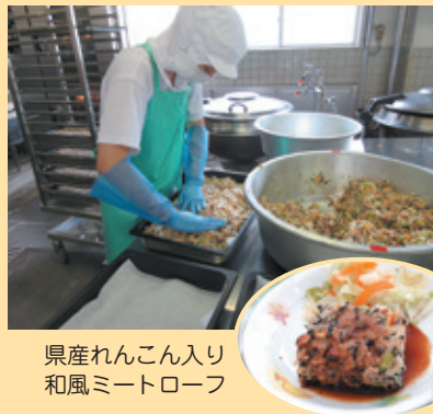
県産れんこん入り 和風ミートローフ