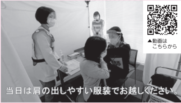
▲動画は こちらから