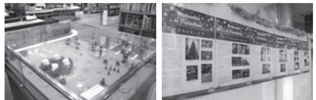
▲昨年のクリスマスポスター展 (市立図書館)