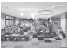
▲子ども読書空間イメージ