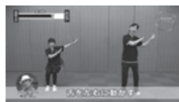
▲ケーブルテレビ(CCNet)で放送中の「おうちでスポーツボイス」