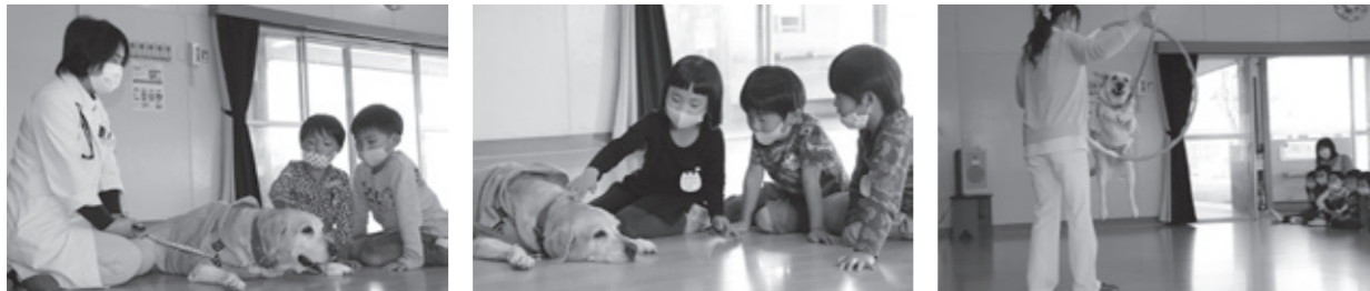
▲訪問時には子どもたちと触れ合ったり、特技を披露したりしています。

職犬は、犬山動物総合医療センターの協力を得て、「セラピー犬」として月に1～3回程度、子ども未来園等を訪問しています。新型コロナの影響で昨年3月から訪問をお休みしていましたが、10月に再開し、新型コロナ対策をとりながら各園の子どもたちに笑顔と元気を届けています。