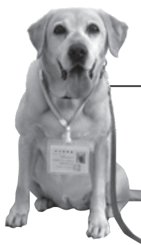
職犬 4代目 ココ

ラブラドルレトリバー 現在12歳 メス 平成28年5月、市長から 辞令を受け職犬に。 優しくおとなしい性格。 食べることが大好き。