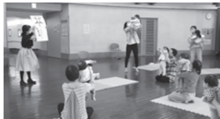
▲1歳児対象の第3期の様子

親子の絆を深めながら、子どもの発達を促すための関わり方や育て方のポイント等のお話を聞きます。講座を通して子育て仲間の輪も広がります。