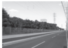
▲村田機械南側冠水対策