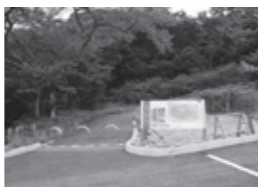
▲整備された東之宮古墳入口