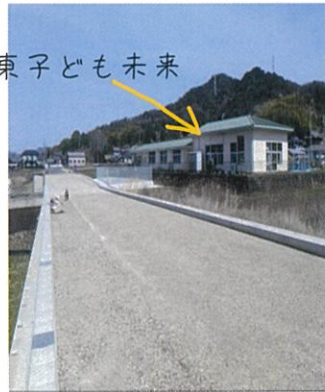
楽田東子ども未来

令和4年度を目標に、何十年もの懸案だった富岡荒井線がいよいよ開通します。楽田東部に新たな南北軸が完成、市南部・楽田にまちづくりの新風が吹き始めます。