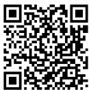
犬山市あんしんメール 登録用QRコード

犬山市に関するいろいろな情報をお知らせしています。犬山市『あんしんメール』や犬山市公式LINEの登録をしていただき、情報を収集するとともに、対応をお願いします。