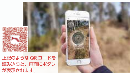
上記のようなQRコードを読み込むと、画面にボタンが表示されます。

現地の看板等に掲載された専用のQRコードを読み込むことで、その場所で見ることのできない、特別なコンテンツをお楽しみいただけます！