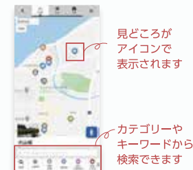
見どころがアイコンで表示されます