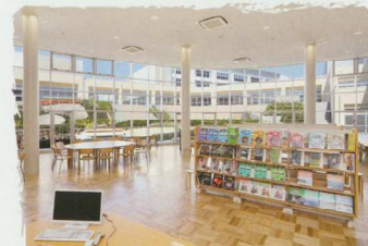
⑦ 小中共用の図書館 全面ガラス張り、中庭や体育館を臨む