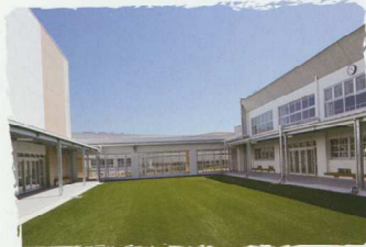
① 全面人工芝のスポーツ広場