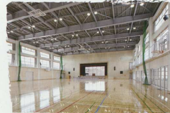
③ 小中の全児童生徒が集まっても十分な広さの第1体育館