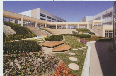
④ 「出会いの広場」は交流の場としての魅力ある空間