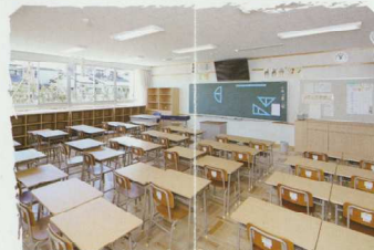
⑥ 新規格の机に合わせ、横に大きく広い教室