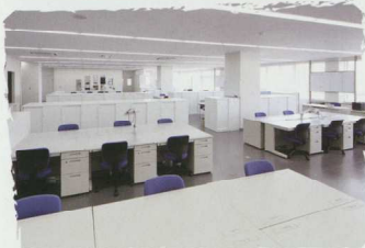
⑤ 小中教職員の連携がはかれる共用の職員室