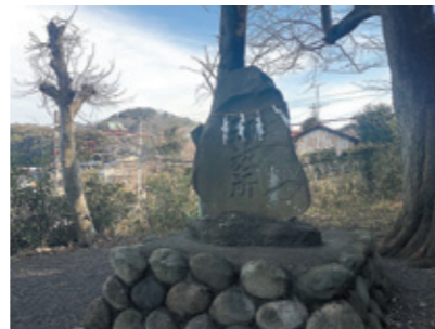
▲御旅所から東之宮古墳を望む

から眺める風景は、ちょうど白山平山頂を崇めるように演出されているようにも見える。祭礼としての犬山祭、渡御という形で神が動く軌跡の中に、「犬山」1800年の歴史が、そこに投影されているとすれば。それを細解いていくと、犬山の原風景とそのデザインの軌跡が見えてくる。そして祭によりリセットされる年周期の壮大な仕掛けが、皆が楽しむ「犬山祭」の中にひっそりと仕込まれているように思えてくる。