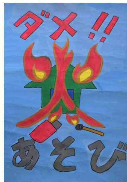
平成30年度 防火ポスター展 小学生の部 優秀作品