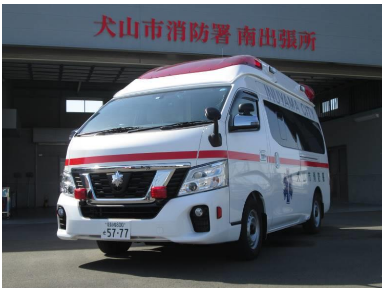
(高規格救急自動車 平成31年2月配備)