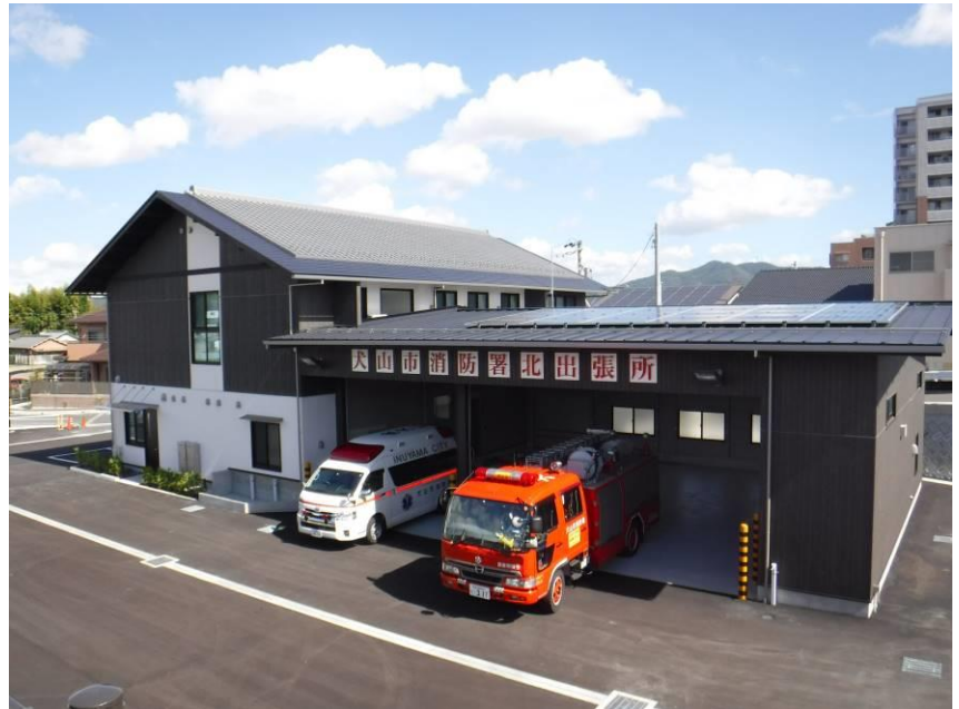
(消防署北出張所 平成30年9月移転)

消防用の施設・機械は、年々複雑多様化する各種災害にいち早く対応するため、常に最新の装備を兼ね備えた消防車両の導入や消防水利の設置などを積極的に進め、消防力の充実強化を図っています。