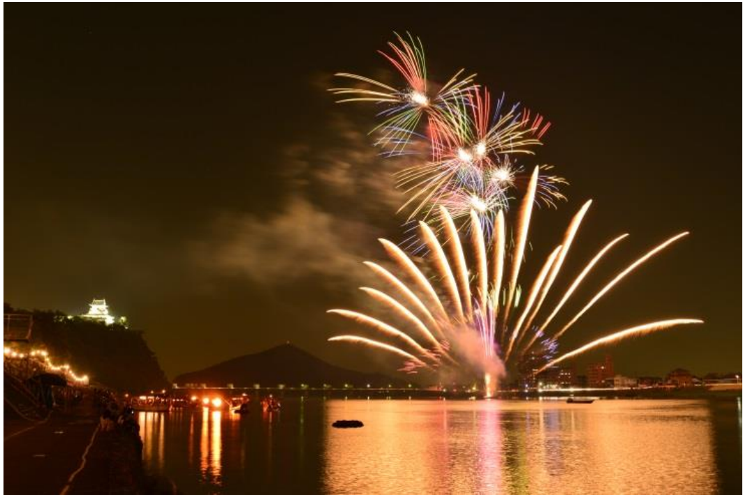
( 木曾川ロングラン花火 )

歴史的遺産を災害から守り、安全で安心な住みよい市民生活を支えるため、消防本部、消防署、消防団が設置されています。