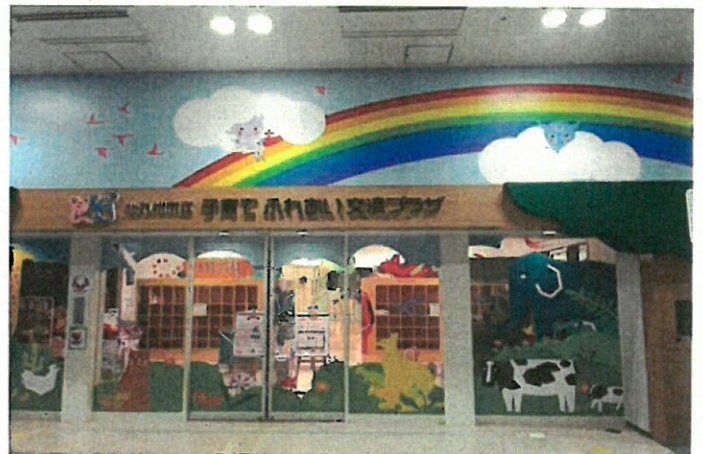
(北九州小倉 子育て交流プラザ元気のもり)

②市民健康館は、現在利用している団体の代替え場所の確保や車に乗らない方の交通手段、整備費用などの問題を解決しなければならない。市民健康館も含めて公共施設の再配置の中でさらには民間施設の活用も視野に入れながら将来的に検討していくべき課題だと考えます。