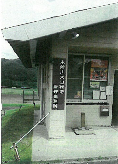
(木曾川犬山緑地公園管理棟)

Q. ①本年度から犬山市でも自殺対策協議会を設置して議論をされるが、当市独自の相談専用ダイヤルを設置できないか。また市HPのトップ画面から「いのちの電話」などにアクセスできるようにならないのか。また自殺予防週間に市内駅頭で啓発グッズを配るなどの活動はできないのか。