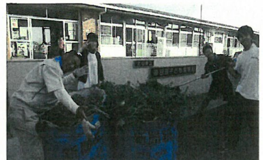
(楽田西保育園での草刈活動)