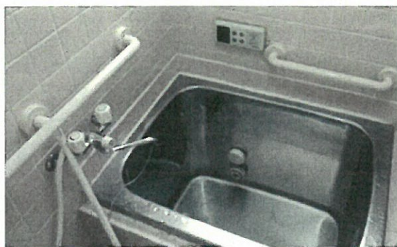
(お風呂場の手すり)

高齢化が進み投票所へ行けなくなる事も予想される、法改正を進めて家でも投票できる様に考える必要がある