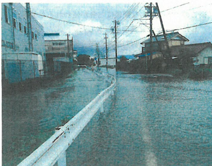
(昨年の8月の大雨の冠水状況)

A. ①市内に居住する40歳以下の世帯が住宅リフォームするときに事業費の1/5で上限10万円、特に親と同居する場合は上限30万円を補助する新たな制度を平成30年度から実施します。