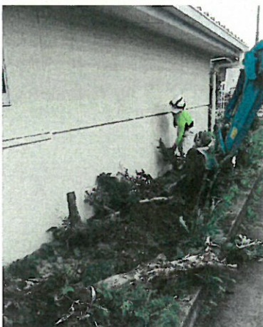
(羽黒南保育園入口花壇整備中)