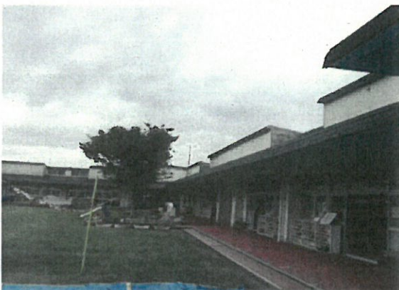
(市内未来園の建物と園庭の様子)

一般の住宅にエアコンを付けるように簡単にはいかず、普通教室全てにエアコンを設置できるように詳細設計し配管工事もしなければならぬため一定の時間が必要になる、また全国一斉にエアコンを設置するため工事業者の選定、エアコン機器の確保も課題となる。来年度の暑さ対策に間に合うよう夏休み前に付ける議会から要望する。