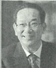
北川正幹 早稲田大学名誉教授