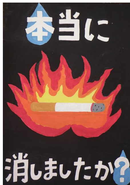
令和元年度 防火ポスター展 小学生の部 優秀作品