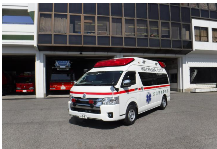
(高規格救急自動車 令和3年3月配備)

消防用の施設・機械は、年々複雑多様化する各種災害にいち早く対応するため、常に最新の装備を兼ね備えた消防車両の導入や消防水利の設置などを積極的に進め、消防力の充実強化を図っています。