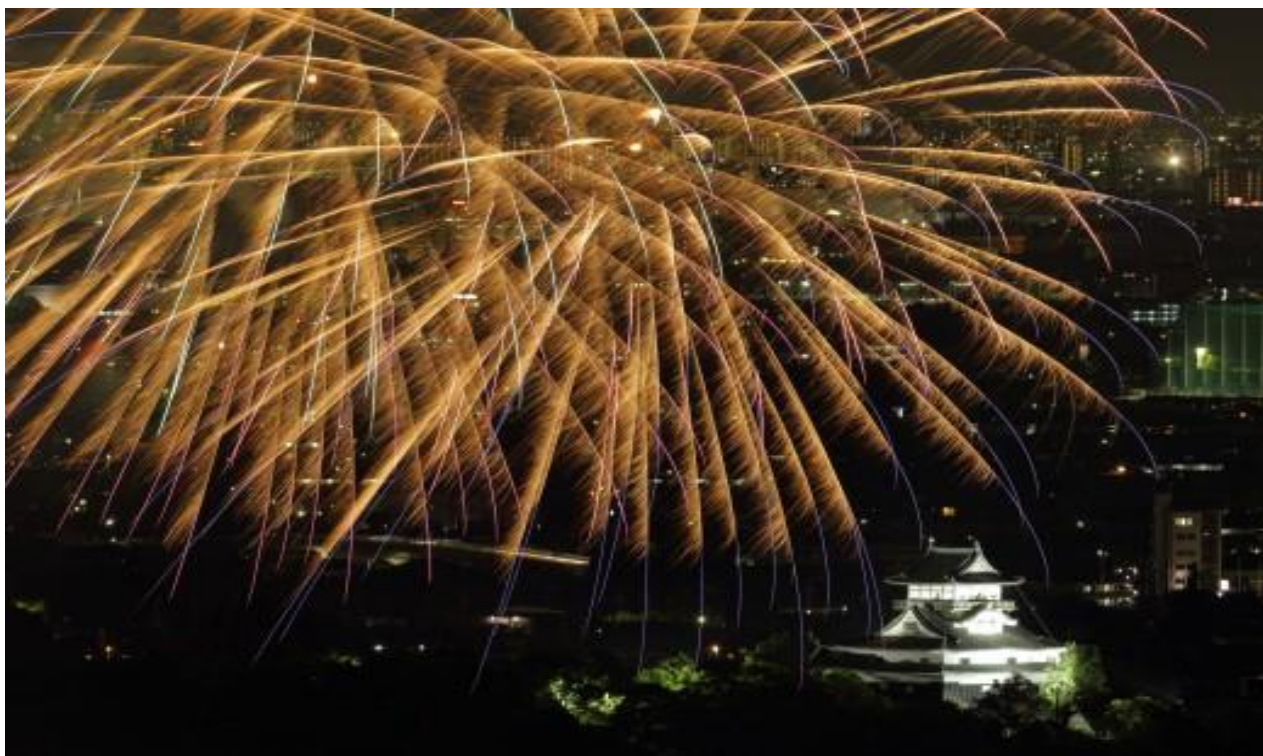
( 日本ライン夏まつり納涼花火大会と犬山城 )

歴史的遺産を災害から守り、安全で安心な住みよい市民生活を支えるため、消防本部、消防署、消防団が設置されています。