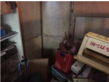
③物置北東部分。北増築部分より撮影。