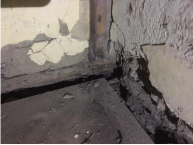
②物置北東角柱。北増築部分より撮影。