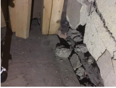
①増築部東柱。北増築部分より撮影。