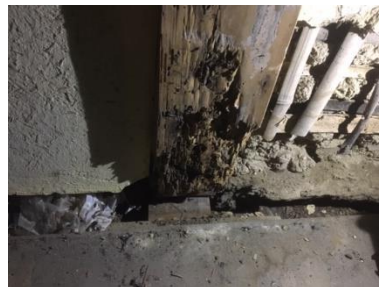
④物置北柱足元。北増築部分より撮影。