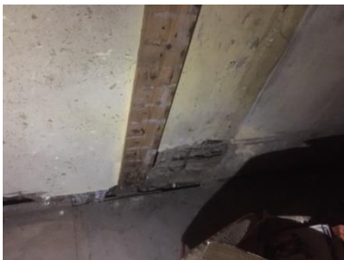
④物置北柱。北増築部分より撮影。