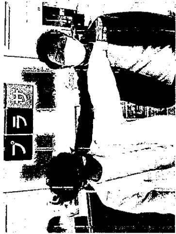
O_COLOR 代表 岡島凌 副代表 小西馨人