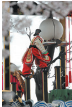
碧南市大浜中区 山車保存会