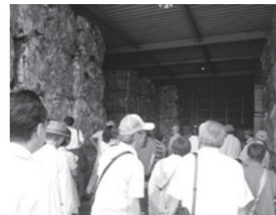
▲株愛北リサイクル犬山保管センター