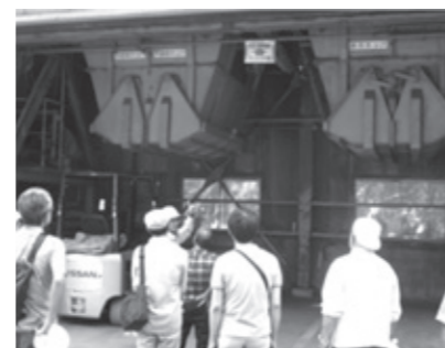
▲市都市美化センター