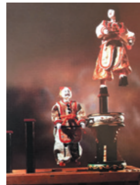
▲碧南市大浜中区のからくり人形

今後も犬山とご縁を大切にお 互いの祭を通し、まちづくりをしっ かり支えていきたいと思えます。