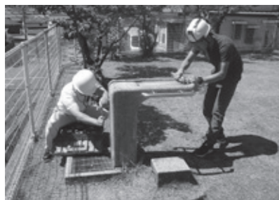
富士苑公園 イヌヤマ設備株式会社による点検

6月1日(金)から7日(木)までの「水道週間」に、犬山市指定水道工事店協同組合12社の協力で、公園などの無人公共施設95か所の水道点検作業が行われました。