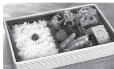
「ささみの黒酢あんかけ弁当」