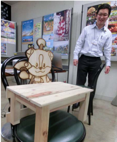
↑イメージが伝わるミニチュア版