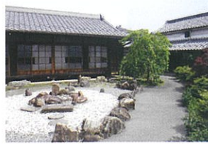
農家と同様に敷地北側に主屋が配置されていますが、南側には農作業場ではなく中庭が造られています。

北側の道路に面して瓦屋根の高塀があり、主屋との間には前庭が造られています。飛び石や灯籠が配され、客の玄関とみなされます。