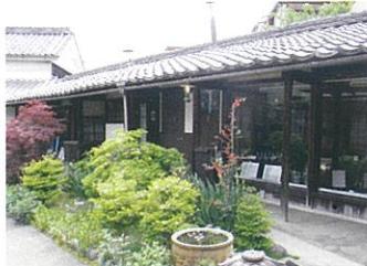
塀を兼ねた渡り廊は長さ約22mです。庇が長く、土蔵や作業場と主屋をつなぐ屋根付きの通路となっています。