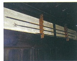
小壁に設けられた「槍架け」