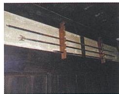
设置在门框上方墙壁上的“枪架”