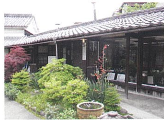
兼作围墙的游廊长约22m。带屋顶，且房檐较长，是一条连接土墙仓房、作业场和主屋的通道。