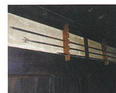
벽 상단에 설치된 '창 걸이'