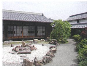
농가와 마찬가지로 부지 북쪽에 주요 건물이 있지만 남쪽에는 작업장이 아닌 안뜰이 조성되어 있습니다.

등록유형문화재 : 본관 · 별채 응접실 · 와타리 복도 · 창고 · 작업장 · 높은 담장