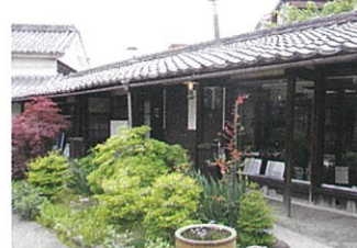
담장을 겸한 와타리 복도는 약22m입니다. 차양이 길어 창고와 작업장과 본관을 이어주는 지붕 달린 통로 역할을 하고 있습니다.