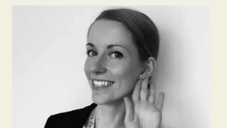
最近お気に入りのピアス

私は様々な文化が共存する、カラフルな世界がとても素敵なことだと思いますが、文化の違いによって入れ墨のように様々な問題も出てきますね。皆さん、海外に行ったとき、その国の習慣を尊重して自分が合わせるべきだと思いますか?それともある程度自分の習慣を認めてほしいですか?また、どこまでが限界になりますか?現在の多文化共生の社会では、その点をしっかりと考えていかなければならないですね。私は世界中の様々な文化に関して理解を深めることが多文化共生には欠かせないと思います。皆さんはどう思いますか?ぜひ意見を聞かせてください!