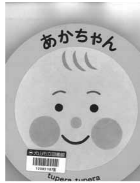
あかちゃん Tupera tupera著

「カップル動画」「ネット炎上」をテーマにした、10代の「リアル」な悩みにこたえるストーリーを3話収録。NHK「オトナヘノベル」番組内のドラマのもとになった小説を再編集。