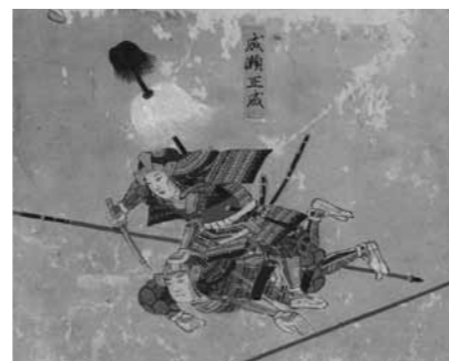
敵の首を獲ろうとする正成 長久手合戦図(部分) 犬山城白帝文庫蔵