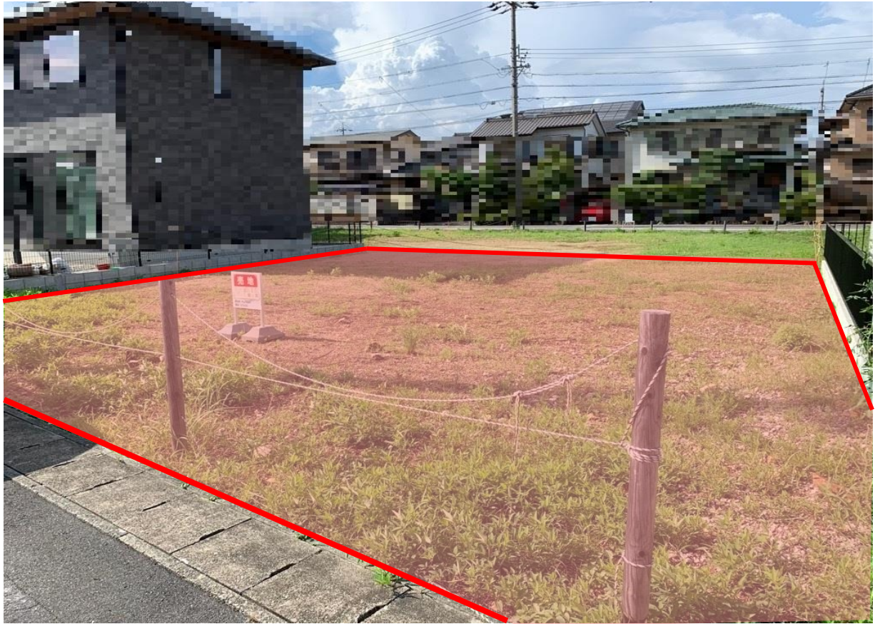
物件番号 5 0 3 犬山市天神町四丁目79番6 (写真② : 北側より)