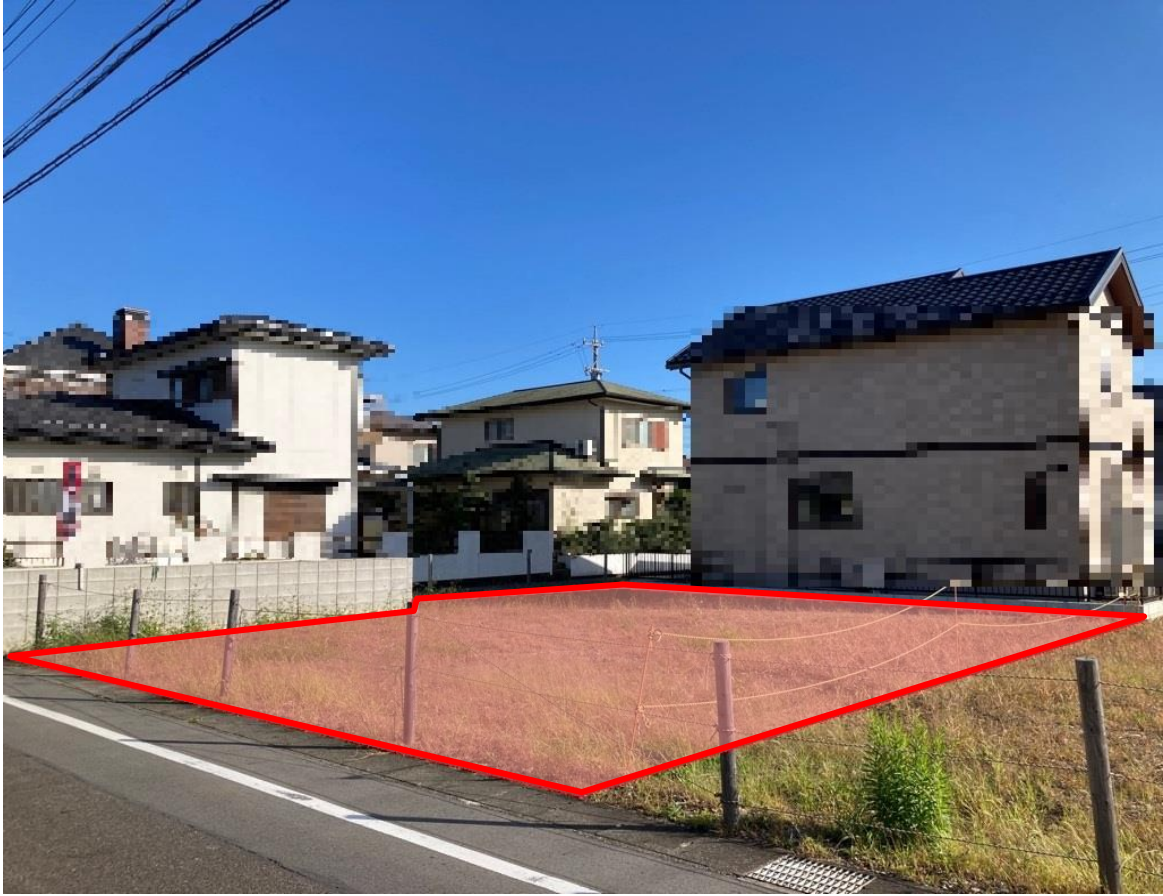
物件番号502 犬山市天神町四丁目79番3 (写真①:東側より)