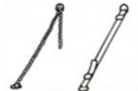
チェーン及びベルト