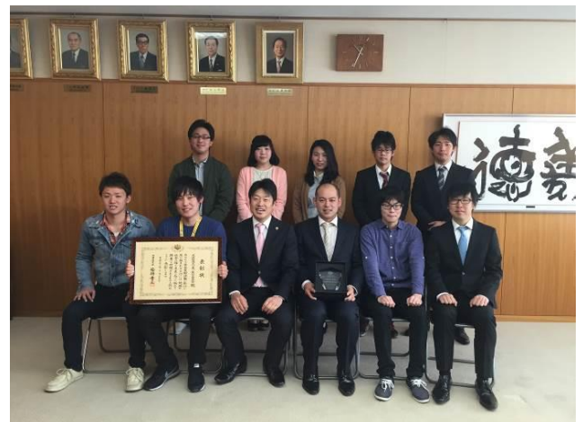
市長表敬訪問（受賞報告）