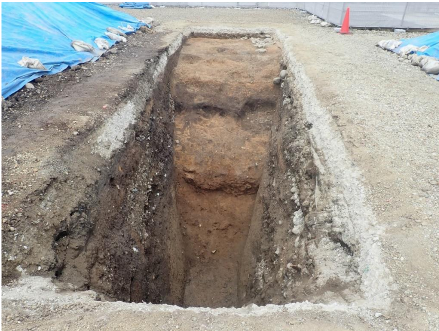
堀斜面出土状況（南から）