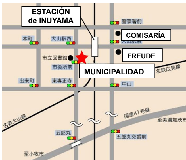
↑ Mapa de la Municipalidad de Inuyama