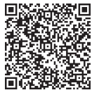
議決結果一覧 はこちら