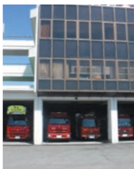
大型化の進む消防車と現庁舎

これまで共同運用が実現したことで一段落し、現在は県下一本化の議論は行われていない状態です。