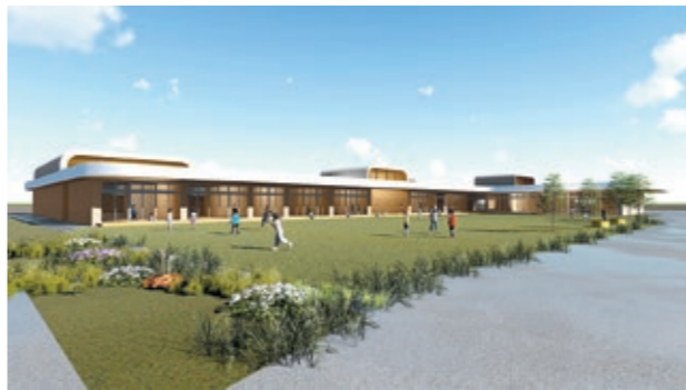
子ども未来園のイメージパース